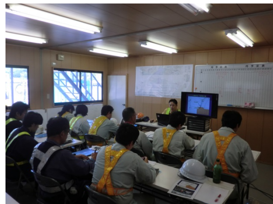
説明及び質疑の様子