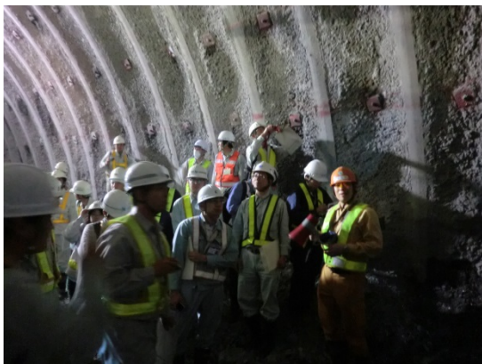
坑内で説明を受ける様子