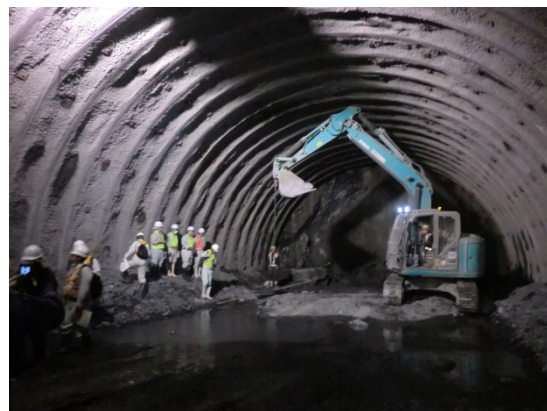
トンネル切羽付近の観察